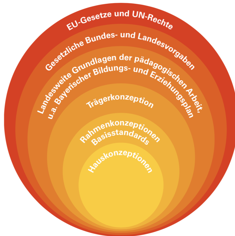
Abbildung 1: Einbettung der Trägerkonzeption in gesetzliche Vorgaben und Standards für KITA